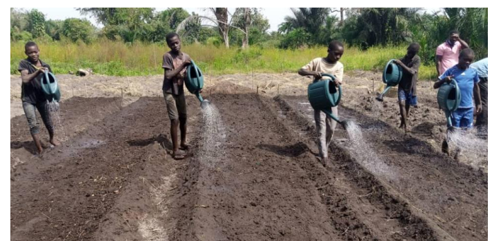
Fiagbomé, si impara ad innaffiare