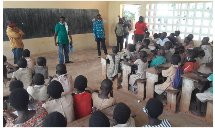
Ananivikondji, il progetto viene spiegato ai bambini