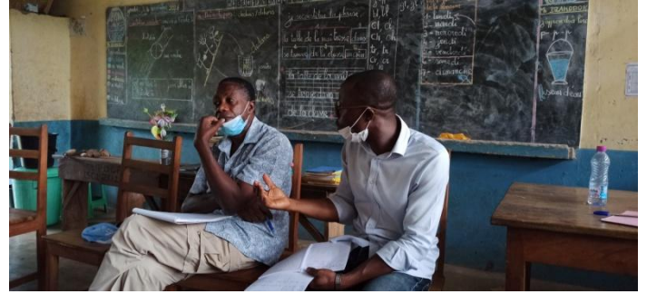
Agou Avédzé, Minondou Miawoè Togo incontra i beneficiari