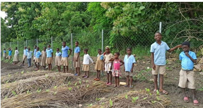
Fiagbomé, un po' di teoria, un po' di pratica